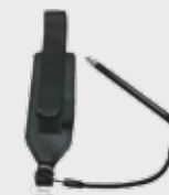
• 94ACC0133 Handschlaufe (im Lieferumfang dabei)