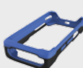
• 94ACC0132 Gummischutzmantel