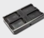
• 94A150074 4-Fach-Akkuladegerät