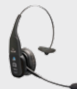
• 94ACC0127 Bluetooth Headset VX1 B350-XT